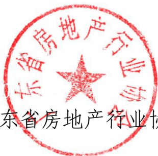
广东省房地产行业协会