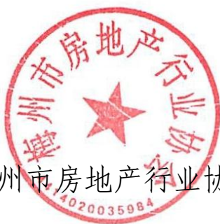
梅州市房地产行业协会